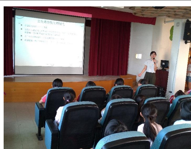
護理師及輔導主任宣導性教育(含愛滋病防治)的重要性